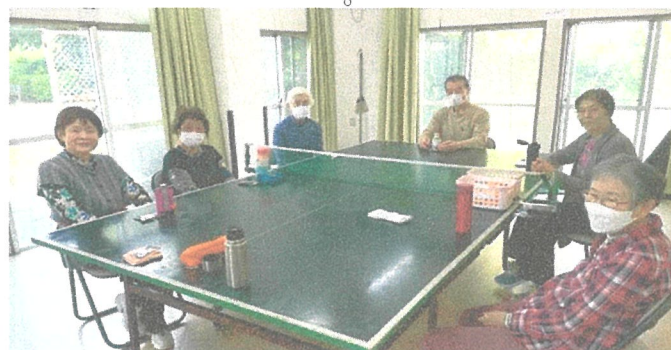
休息中の“シルバークラブ卓球部”の皆さん